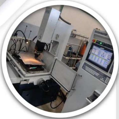
2 Erosionadoras de Penetración