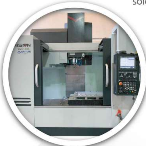
2 centros de maquinado Haitian VMC1000