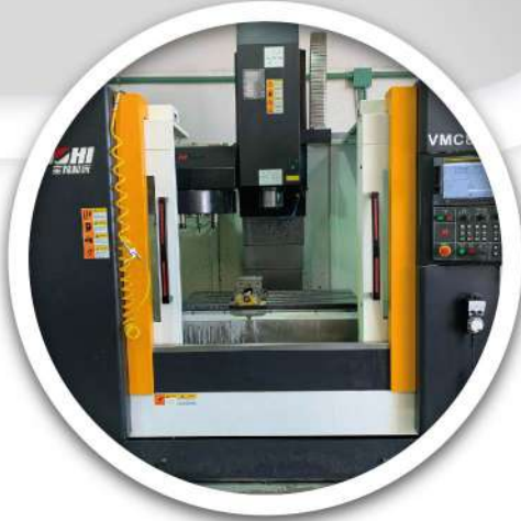
2 Centros de maquinado CNC Boohi de 3 ejes