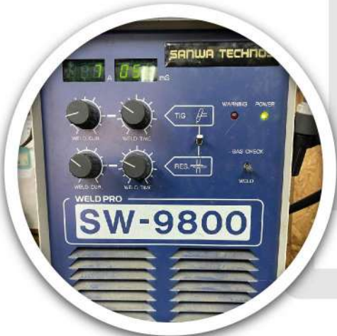
Equipo de micro soldadura