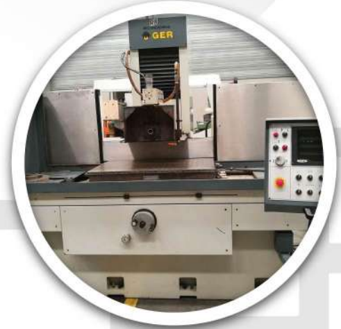
Rectificadora de Superficies planas