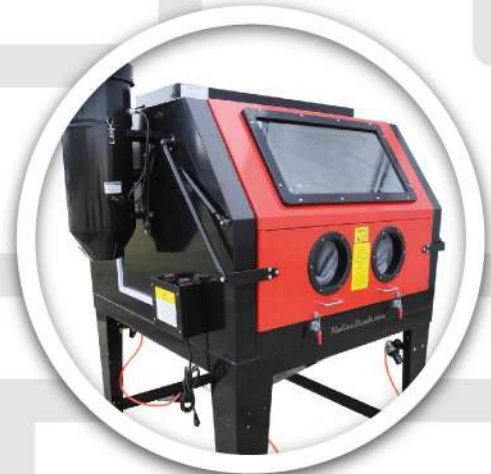
Equipo de Sandblasteo